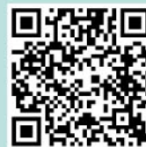
下関観光コンベンション協会 ホームページ