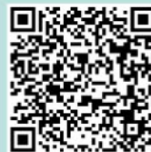
下関市公式観光サイト 楽しみ!

下関市観光政策課 ☎083-227-3305 下関観光コンベンション協会 ☎083-223-1144