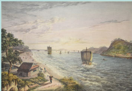
ファン・デル・カペレン海峡図

ファン・デル・カペレンは、オランダ領インド総督を務めており、日蘭貿易を再検討するために、シーボルトを日本に派遣した人物。シーボルトは日本で研究する機会を与えてくれた人物の名前を海峡に名づけた。