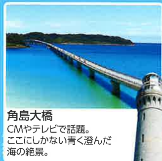
角島大橋 CMやテレビで話題。 ここにしかない青く澄んだ 海の絶景。