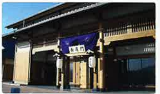
道の駅蛸街道西ノ市 梨や新鮮な野菜など豊田町ならではの 特産品が魅力!