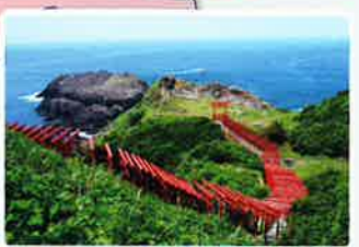
元乃隅神社 CNN 日本の最も美しい場所31選