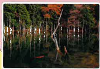
一の俣桜公園 神秘的な風景が撮れる?癒しスポット。