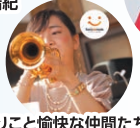
よりこと愉快的仲間たち