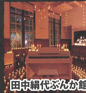
田中絹代ぶんか館