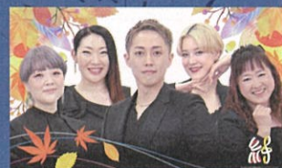
今年は「下関まきな音楽祭」コラボ！ コスプレグループ「VOJA」のライブも(16日)

<主催>関門海峡イベント実行委員会 <共催>関門海峡日本遺産協議会 <後援>北九州市(申請中)、下関市、下関市教育委員会 <協賛>LOVE COLOR <協力>エキマチ下関推進協議会、赤間ヶ関いり賑わい倶楽部、株式会社リ・ソーシャルマネジメント、株式会社安成工務店 下関市立大学 SCU～地域魅力発信し隊～、市内大学生・高校生・中学生・小学生、幼稚園 保育園、一般市民ボランティアの皆さん <問合せ>門司側：一般社団法人 BASEMENT 北九州 070-8376-7103 下関側：JOIN083 083-227-4404