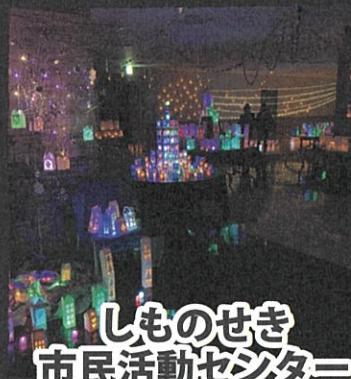
しものせき 市民活動センター