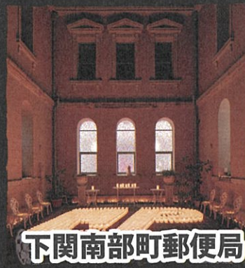
下関南部町郵便局