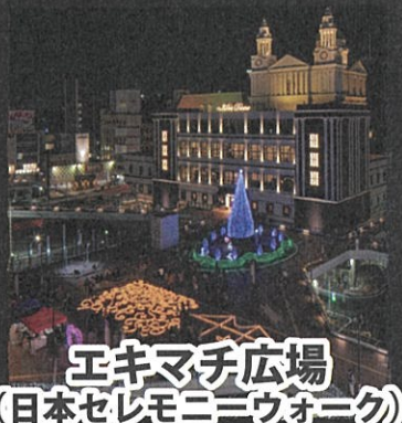
エキマチ広場 (日本セレモニーウォーク)