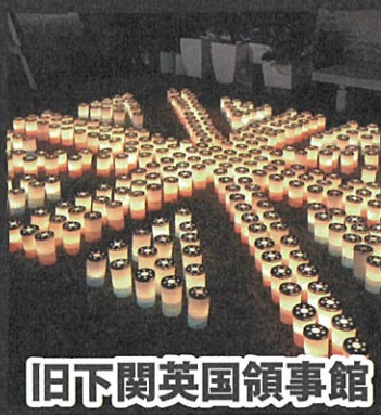
旧下関英国領事館